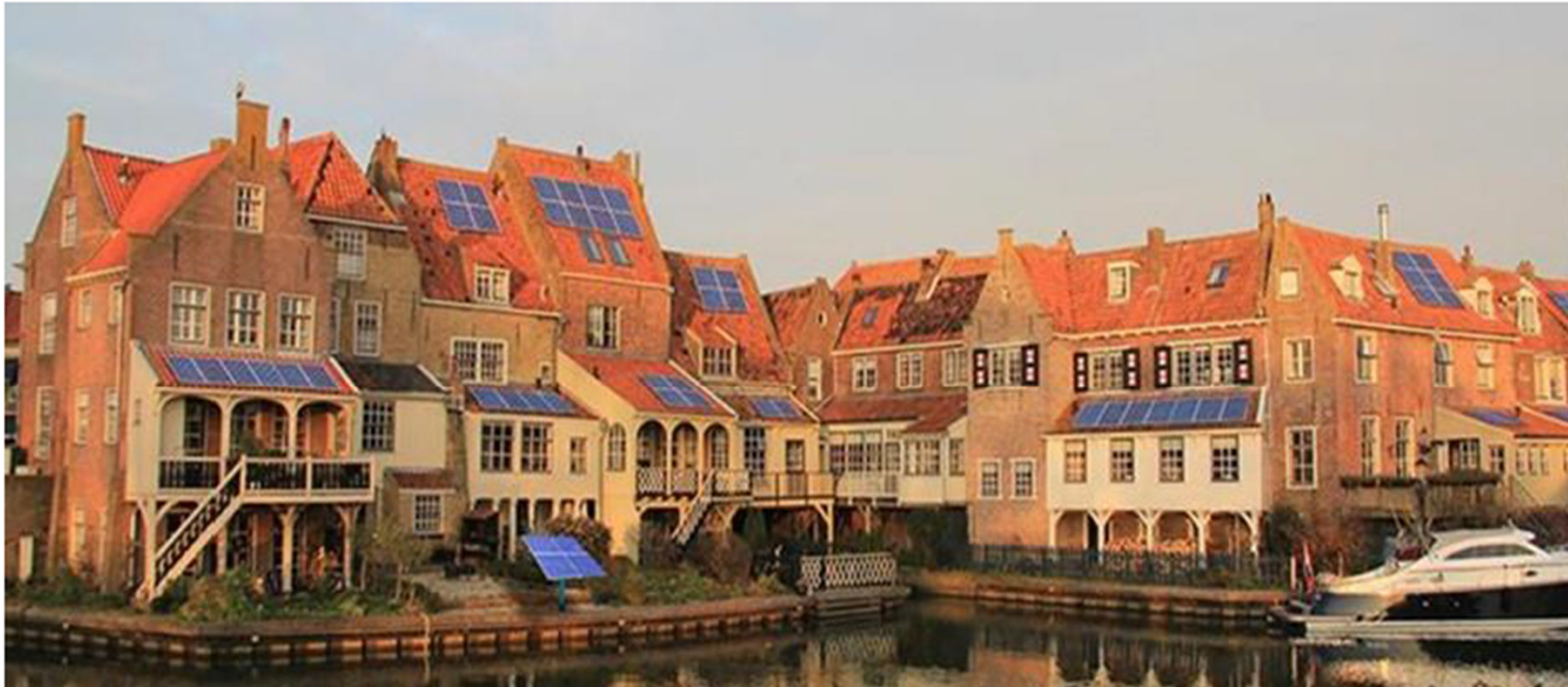
Het beschermd stadsgezicht van Enkhuizen voorzien van gefotoshopte zonnepanelen. Met dank aan Frans van Leeuwen van TIF Creative Concepts te Enkhuizen.